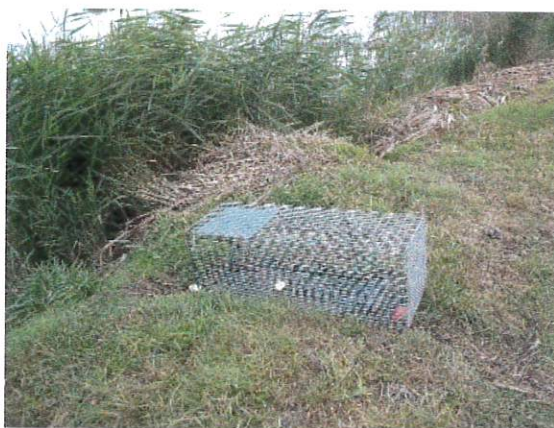
Cage-piège sélective

☛ La lutte contre les rongeurs aquatiques (ragondins et rats musqués) permet de diminuer les risques de contracter la leptospirose (20 % des ragondins et 35 % des rats musqués sont potentiellement excréteurs de cette bactérie - étude 2010).